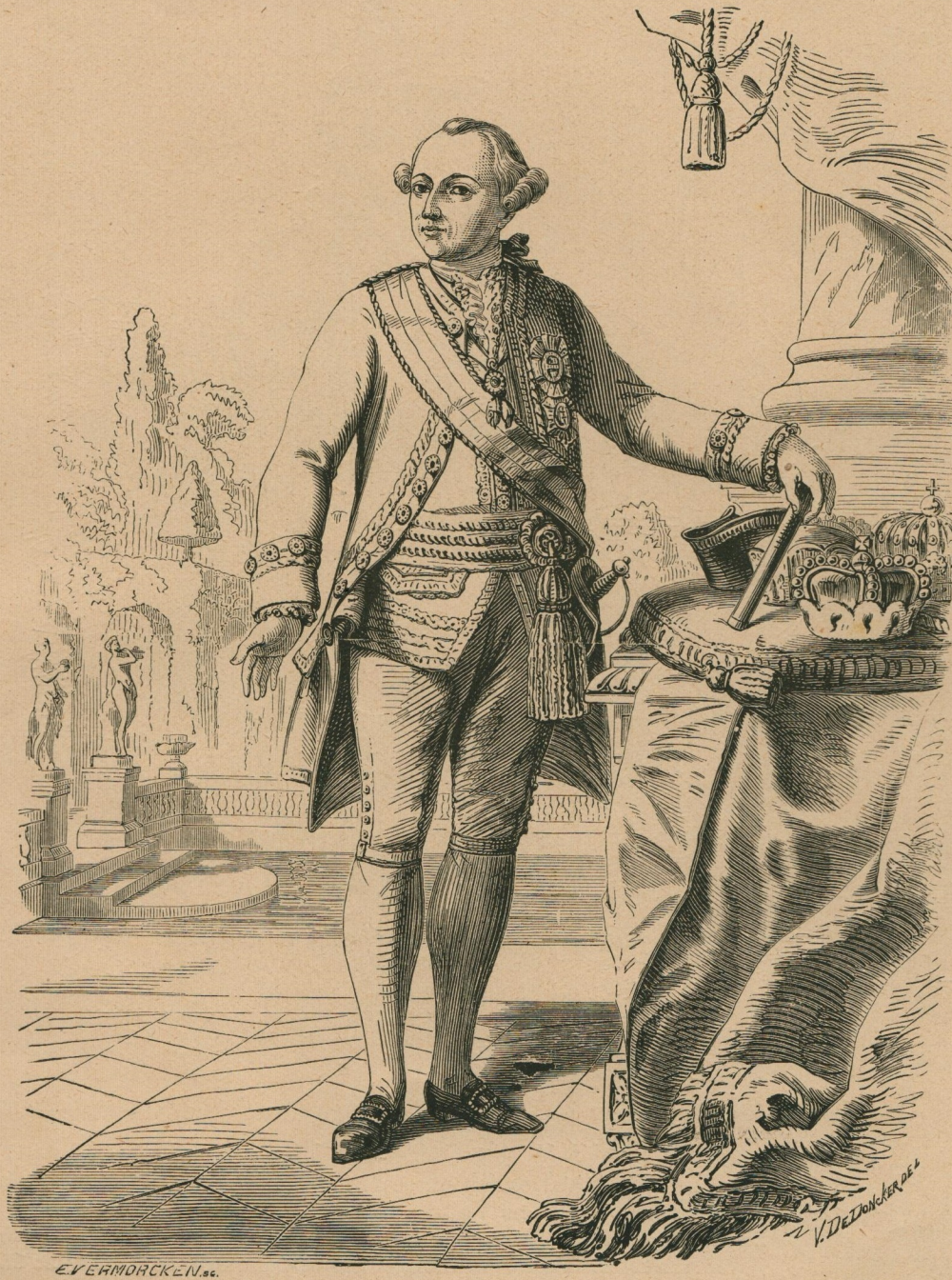
247. — L'empereur Joseph II, fils de Marie-Thérèse, mort le 20 février 1790. Keizer Jozef II, zoon van Maria Theresia, overleden den 20 n Februari 1790.